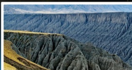
แกรนด์แคนยอนคู่ชานจื่อ