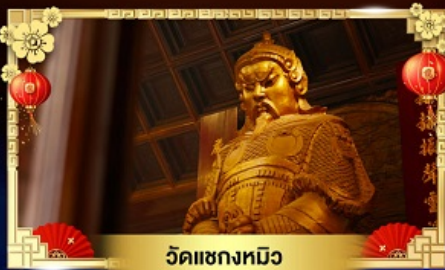
วัดแซกทมิฬ