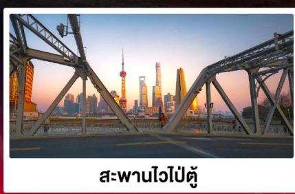
สะพานไวปี้ตู่