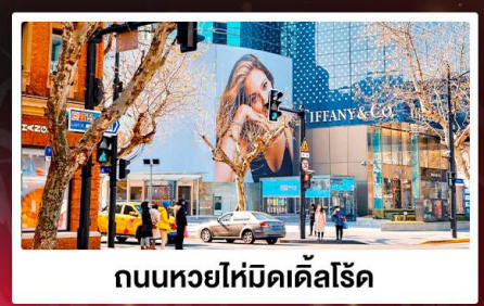
ถนนหวยไห่มีดเคิ้ลโรด