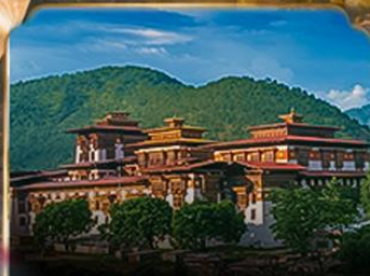
พุนาคาของ PUNAKA DZONG