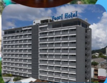
โรงแรมเพิร์ล