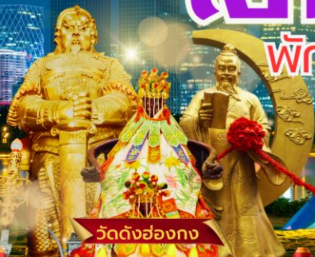
วัดดั่งฮ่องกง