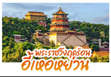
พระราชวังฤดูร้อน อี้เซอเฉยวัน