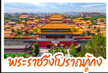
พระราชวังโบราณต้องห้าม