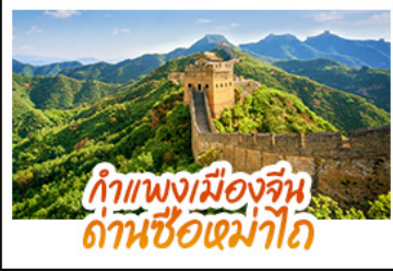
กำแพงเมืองจีน ด่านซ็อกมาโต