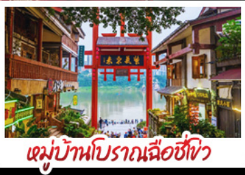
หมู่บ้านโบราณฉือชี่ไว