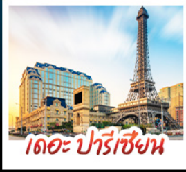
เดอะ ปารีสเซียน

สัมผัสบรรยากาศ เดอะ เวนเซียน มาเก๊า เสมือนได้เยือนลาสเวกัส ชมความวิจิตรตระการตาของพระราชวังหยวนหมิงหยวนใหม่แห่งจูไห่ เช็กอินกับแลนด์มาร์กสุดฮิตจตุรัสวาทิงท่าเรือรูปหอยทิวของกวางเจา เที่ยวชมหมู่บ้านสไตล์ยุโรปแห่งใหม่ของเซินจิน • ช้อปปิ้งเพลิน ๆ ที่ห้างสรรพสินค้า COCO PARK ถนนคนเดินฟู้หวู่หลี่และถนนคนเดินปิกกิง