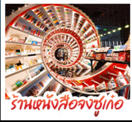
ร้านหนังสือจุงซูโก