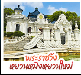
พระราชวัง เฉียนเหมิงเฉียนเหมิง