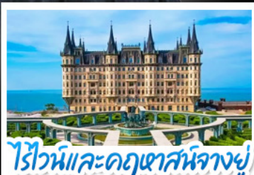
ไรไวน์และคฤหาสน์นางอยู่