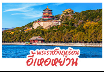
พระราชวังฤดูร้อน ฮ้อเจ้อเซว่น