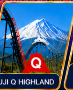
FUJI Q HIGHLAND