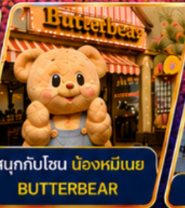
สนุกกับโซน น่องหมีเนย BUTTERBEAR