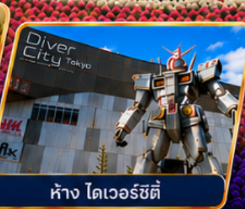
ห้าง โตเวอร์ซิตี