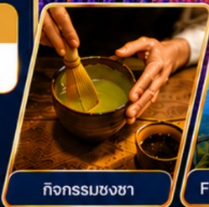
กิจกรรมชงชา