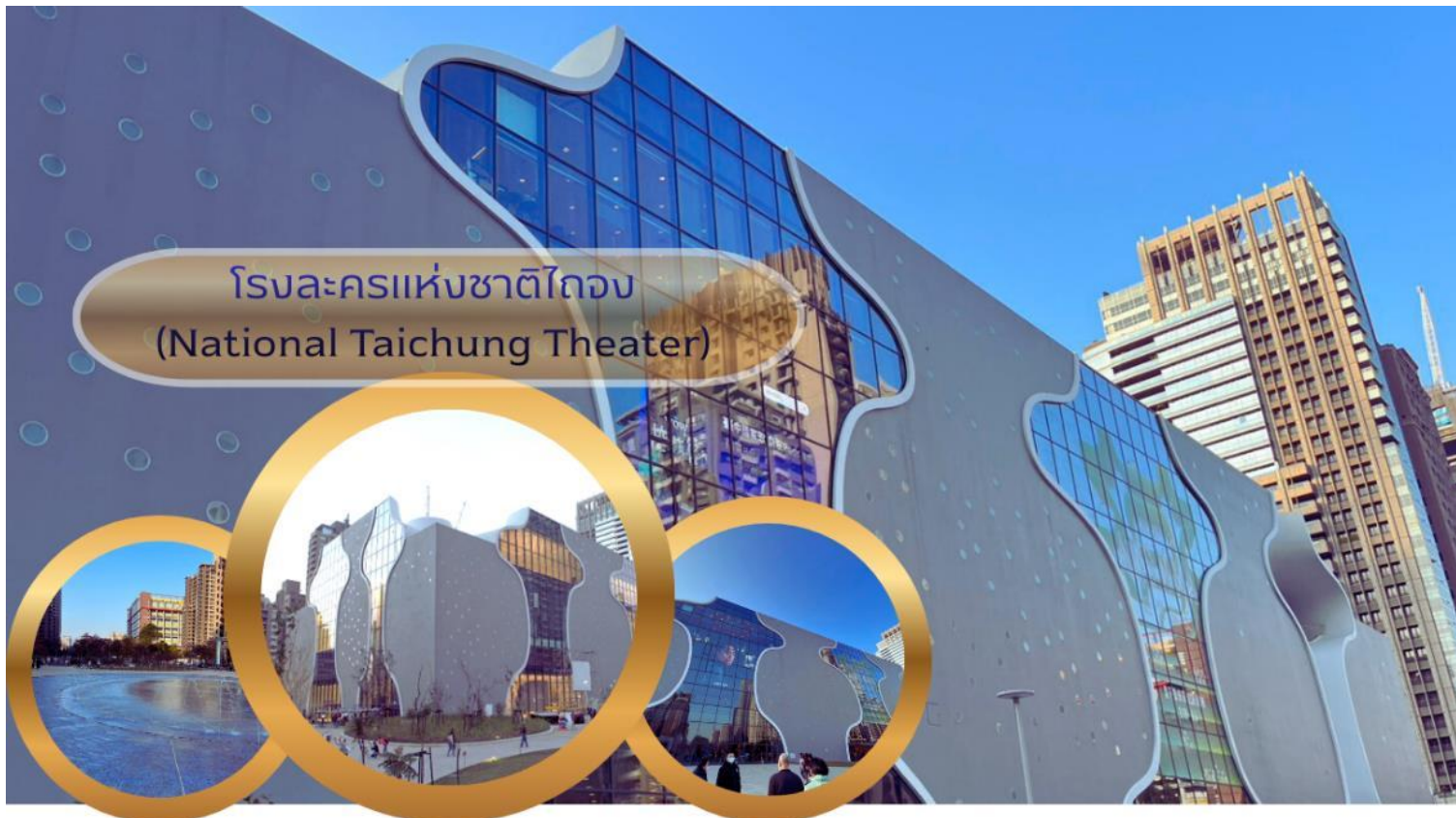
โรงละครแห่งชาติไถจง (National Taichung Theater)

และเรียบหรู" โรงละครถูกออกแบบโดยสถาปนิกชาวญี่ปุ่นชื่อดัง โทโย อิตะ (Ito Toyo) เจ้าของรางวัล Pritzker (รางวัลอันดับหนึ่งของวงการสถาปัตยกรรมโลก) แรงบันดาลใจในการออกแบบโรงละครแห่งชาติไถจง ได้รับแนวคิดมาจาก "ถ้ำเสียง" (Sound Cave) ทำให้มีการออกแบบผนังโค้ง รู และท่อที่เป็นเอกลักษณ์ ก่อสร้างให้อาคารทั้งหลังไม่มีคานและเสารองรับ รวมถึงไม่มีจุดใดของกำแพงที่ทำมุมฉาก 90 องศา จึงทำให้ดีไซน์ของโรงละครแห่งนี้แตกต่างจากอาคารทั่วไป ภายในอาคารประกอบด้วยโรงละคร 3 แห่ง รวมถึงพื้นที่อเนกประสงค์ "Corner Salon" และสวนลอยฟ้า (Rooftop Sky Garden) จึงทำให้โรงละครแห่งชาติไถจงสวยงาม มีเอกลักษณ์ไม่ซ้ำใคร