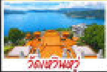
วัดผิงอัน