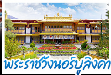
พระราชวังฤดูร้อนแออร์บูคิงดา