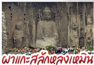
พลาแกะสลักหลงเหมิน

เที่ยวครบ 4 มรดกโลก ถ้ำหลงเหมิน - สุสานจีนชิงฮ่องเต้ - วัดเส้าหลิน หมู่บ้านไต้คินसानโจว - หมู่บ้านกัวลี้ยงชุน