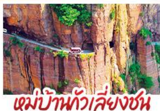
หมู่บ้านกัวลี้ยงชุน