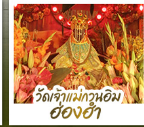
วัดเจ้าแม่กวนฮอมฮ่องฮ่า