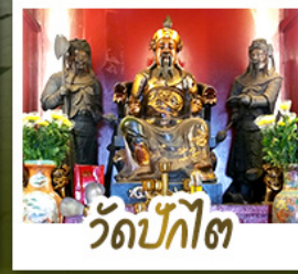
วัดป้กไต้