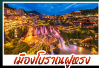
เมืองโบราณฝูเฉิง