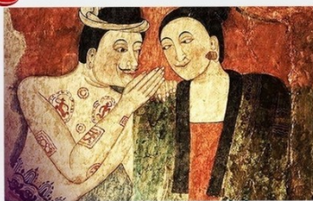
จิตรกรรมฝาผนังพม่า