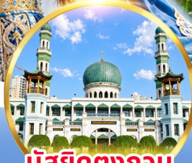
มัสยิดตงกอน