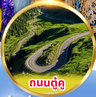
ถนนตุ๋นคู