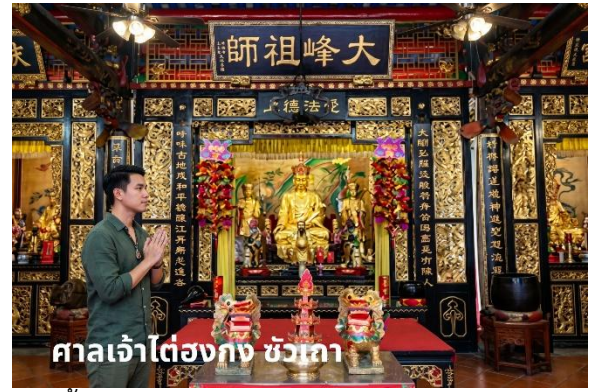
ศาลเจ้าไต้ฮงกง ชัวเถา

นำท่านสู่ ศาลเจ้าไต้ฮงกง (ปอเต็กตึ๊ง) นมัสการไต้ฮงกงอันเป็นที่นับถือของชาวจีนในเรื่องความเมตตากรุณาของท่าน ปัจจุบันสุสานแห่งนี้ได้รับการบูรณะซ่อมแซมจากการร่วมบริจาคของชาวจีน จนมีความใหญ่โตและสวยงามสถานที่ท่องเที่ยวแห่งนี้เกิดจากหลวงพ่อดำเพ็งจูซื่อ สมัยราชวงศ์ซ่ง ตามจดบันทึกของโบราณคดี ดำเพ็งจูซื่อเป็นคนสมัยราชวงศ์ซ่ง เกิดที่อำเภอเวินโจว มณฑลเจ้อเจียง สอบได้จิ้นสี่เป็นข้าราชการชั้นผู้ใหญ่แต่เห็นการปกครองและข้าราชการไม่ดี จึงออกบวชเป็นพระชุดงค์มาถึงหมู่บ้านเหอผิงหลี่มณฑลกวางตุ้ง ได้สร้างวัดสร้างโรงเรียนสร้างสะพานและช่วยรักษาโรคภัยไข้เจ็บให้แก่ชาวบ้านตลอดมา หลังมรณภาพชาวบ้านได้ฝังศพ ณ ที่เหอ ผิงหลี่ และสร้างศาลเจ้าไว้เพื่อเป็นการรำลึกถึงบุญคุณและความดีขององค์ ไต้ฮงกงผู้นี้