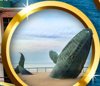
ประติมากรรม วาฬผู้โดดเดี่ยว