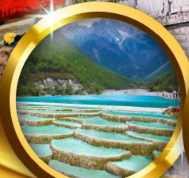
ทะเลสาบไ้สยเห่อ