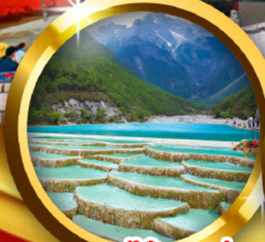
ทะเลสาบไ้สวยเห่อ