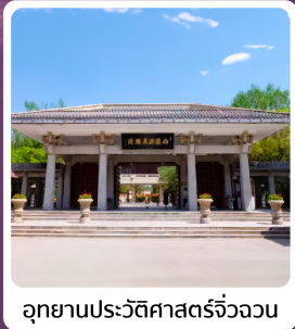
อุทยานประวัติศาสตร์จี้ววงวน