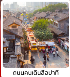
ถนนคนเดินสี่อ่าตี้