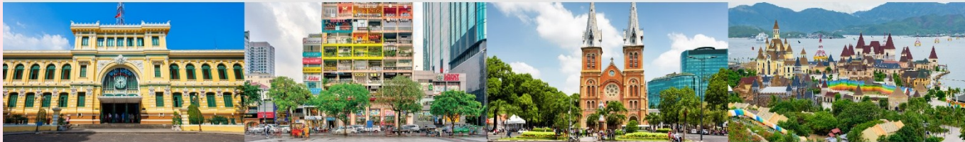
ไพรบิชย์กลางโฮจิมินห์