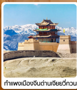
กำแพงเมืองจีนด่านเจียหยี่กวน