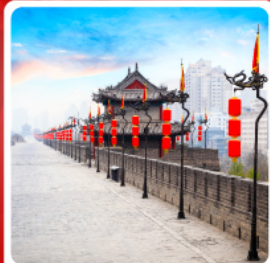
กำแพงเมืองโบราณซีอาน