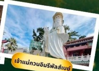
เจ้าแม่กวนอิมริฟัสเบย์