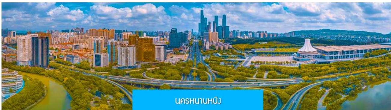
นครพนมหนิง