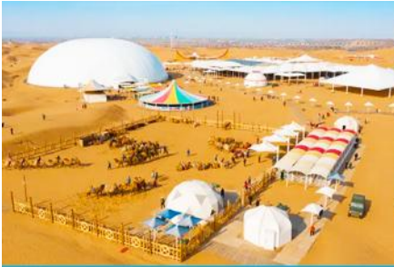
เกาะกลางทะเลทรายเซียนซาเต๋า