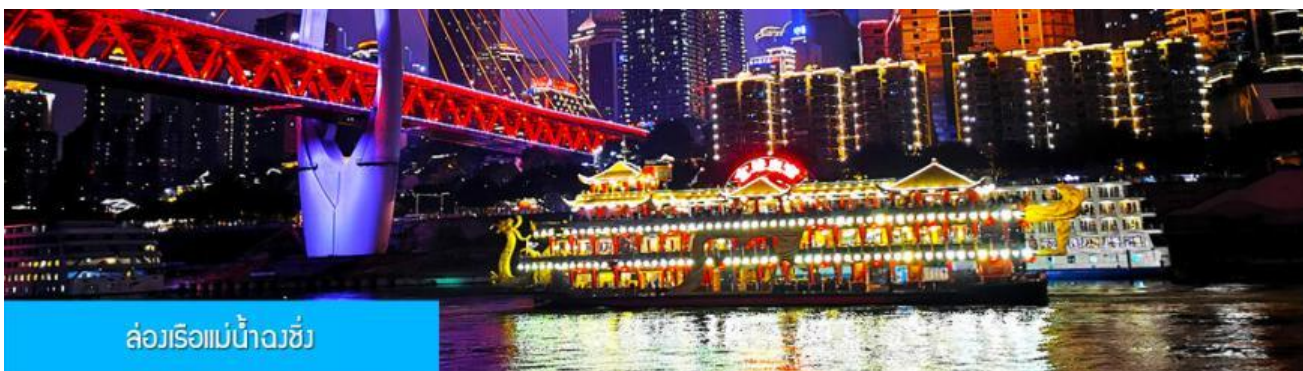
ล่องเรือแม่น้ำจิ่ง

รับประทานอาหารค่ำ ณ ภัตตาคาร (6) (เมนูสุกี้หม่าล่าต้นตำหรับจงชิ่ง)