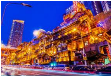
ย่านหงหยาดัว