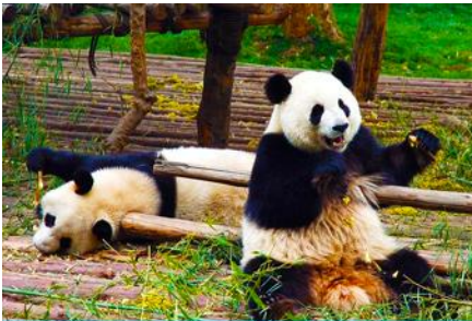
ศูนย์อนุรักษ์หมีแพนด้าเมืองตูเจียงเยียน

หลังอาหารท่านสามารถเลือกที่จะซื้อโปรแกรมทัวร์เสริม หรืออิสระพักผ่อนตามอัธยาศัยในโรงแรม