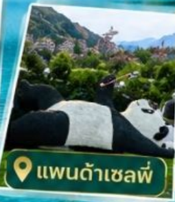
📍 แพนด้าเซลฟ์