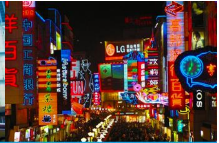
ถนนคนเดินชุนชี่ลู่