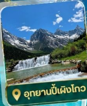
📍 อุทยานปีเพิงโกว

17 - 21 กรกฎาคม 69 24-28 กรกฎาคม 69 28 ก.ค. - 01 ส.ค. 69