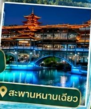
📍 สะพานหนานเจียว