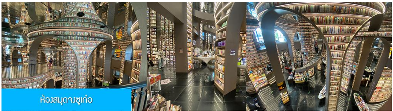
ห้องสมุดวงซูก่อ