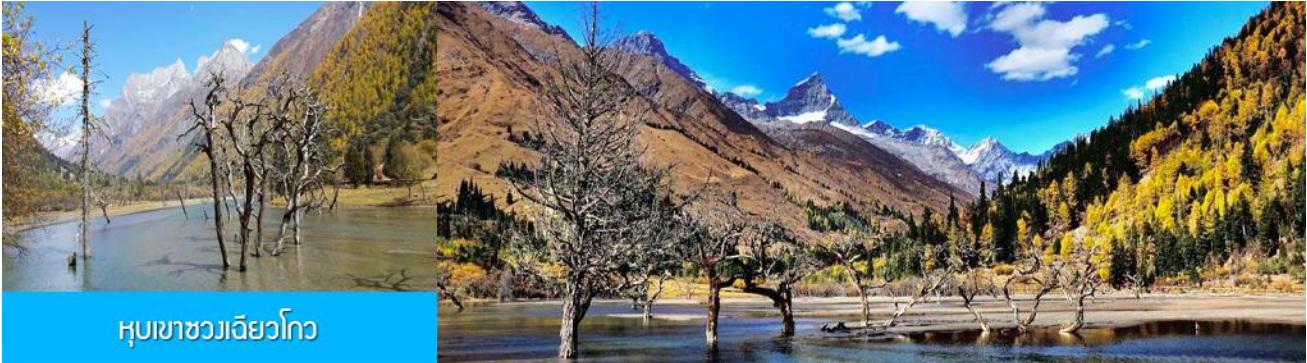
หุบเขาขวงเจียวโกว

หลังอาหารนำท่านเที่ยวชม หุบเขาขวงเจียวโกว 双桥沟景区 ที่เป็นแหล่งท่องเที่ยวที่สวยงามที่สุดแห่งหนึ่งในเขตอุทยานภูเขาสี่ครุณี นำท่านนั่งรถบัสของอุทยานที่วิ่งไปผ่านเส้นทางที่สร้างคู่ขนานกับลำธารภสยในหุบเขา ท่านจะได้สัมผัสกับความสวยงามของทัศนียภาพธรรมชาติที่หาชมได้ยาก โดยมีภูเขาหิมะสูงตระหง่านอยู่เบื้องหลัง ธารน้ำใสไหลริน และสระน้ำที่มีสีเขียวมรกต ในฤดูใบไม้ผลิและฤดูร้อนท่านจะได้เห็นฝูงจามรีท่ามกลางทุ่งหญ้าเขียวจี ส่วนในฤดูหนาวทุ่งหญ้าและพื้นดินจะปกคลุมด้วยพรมหิมะสีขาว....รถบัสของอุทยานจะนำนักท่องเที่ยวไปยังจุดชมวิวสำคัญต่าง ๆ ภายในเขตอุทยาน เพื่อให้นักท่องเที่ยวได้เที่ยวชมสถานที่และถ่ายรูปตามอัชฌาศัย จนครบแ่เวลา นำคณะขึ้นรถบัสออกจากอุทยาน นำท่านเดินทางกลับเมืองตูเจียงเยียน