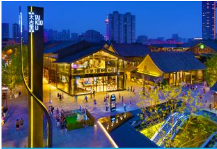
ถนนไท่กุ่หลี่ และวัดต้าฉีอว