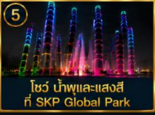
5 โซว น้าพุและแสงสีที่ SKP Global Park