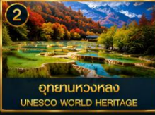
2 อุทยานหวงหลง UNESCO WORLD HERITAGE