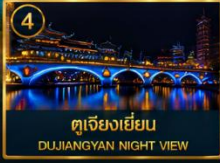
4 ตูเจียงเยียน DUJIANGYAN NIGHT VIEW