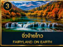
3 จิวจ้ายโกว FAIRYLAND ON EARTH