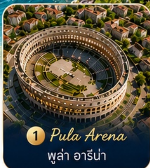
1 Pula Arena พูล่า อาร์น่า