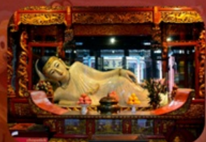
สักการะวัดพระหยกขาว