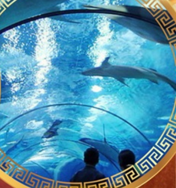
เซี่ยงไฮ้อาเซียนอะควาเรียม