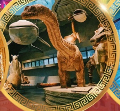
พิพิธภัณฑ์ธรรมชาติเซี่ยงไฮ้