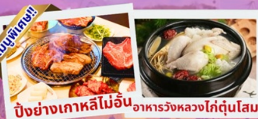
ปิ้งย่างเกาหลีไม่อั้น อาหารวังหลวงไก่ตุ๋นโสม