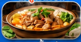
สุกี้ไก่