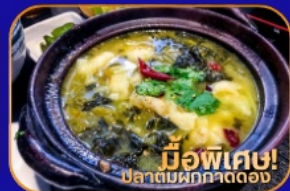
มีอพิเศษ! ปลาต้มผักกาดดอง