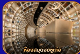
ห้างสมุดจงซูเก๋อ