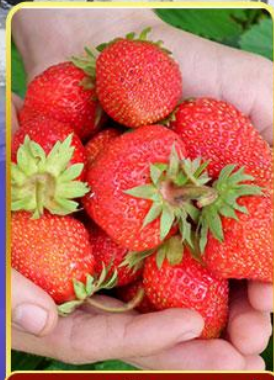
กิจกรรมเก็บสตอเบอรี่