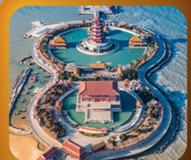
“แปดเซียนข้ามทะเล”

เสน่ห์เมืองชายฝั่งจินตตอนเหนือ • เวนิสตะวันออก • เก็บผลไม้ ณ สวนต้าเหลียน เมืองเหยียนโต • ท่าเรือโซ่ขาว ปลาขาวพวยกตั้น • เมืองเฝิงไหล • แปดเซียนข้ามทะเล เมืองเว่ยไห่ • ถนนคอบเพลิงเลว 8 • ซากเรือบลูเวย์ • Korean Town • หมู่บ้านซาจื่อโจว สะพานจันเฉียว • โบสถ์เซนต์โมเคล • พิพิธภัณฑ์เบียร์ซิงเต่า • อ่าวผู้ชานวาน