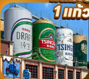
“พิพิธภัณฑ์เบียร์ซิงเต่า”

เสน่ห์เมืองชายฝั่งจินตตอนเหนือ • เวนิสตะวันออก • เก็บผลไม้ ณ สวนต้าเหลียน เมืองเหยียนโต • ท่าเรือโซ่ขาว ปลาขาวพวยกตั้น • เมืองเฝิงไหล • แปดเซียนข้ามทะเล เมืองเว่ยไห่ • ถนนคอบเพลิงเลว 8 • ซากเรือบลูเวย์ • Korean Town • หมู่บ้านซาจื่อโจว สะพานจันเฉียว • โบสถ์เซนต์โมเคล • พิพิธภัณฑ์เบียร์ซิงเต่า • อ่าวผู้ชานวาน