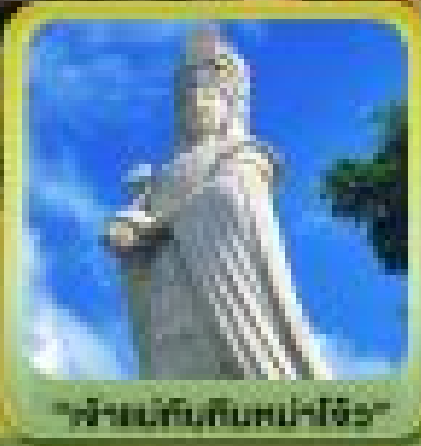
"ฟ้าอันเกินเกินหม่าโจ้ว"