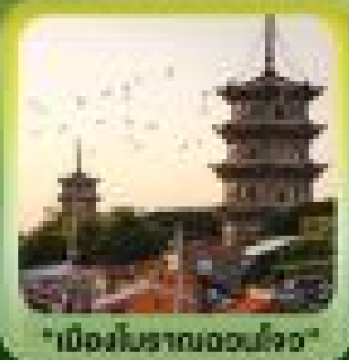
"เมืองโบราณฉวนโจว"