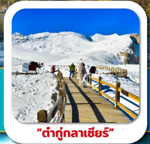
"ต้ากู่กลาเซียร์"

เที่ยวชมความงาม 3 อุทยานชื่อดัง : สี่ดรุณี • ปีเฟิงโกว ต้ากู่กลาเซียร์ ชมความน่ารักของหมีแพนด้า • จัตุรัสหยางเทียนวู่ ชอยกว้างชอยแคบ • ถนนคนเดินซุนซีลู่ • POP MART