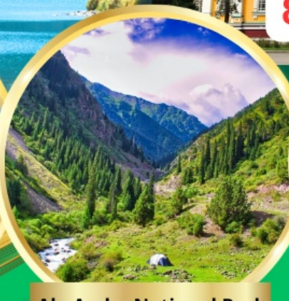
Ala Archa National Park