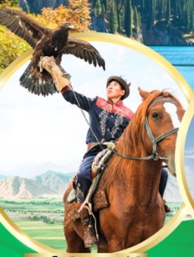
ชมโซว์นคอินทรีย์