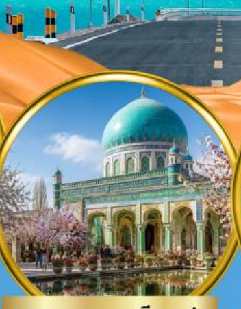
สุสานสนมหอมเซียนเฟย