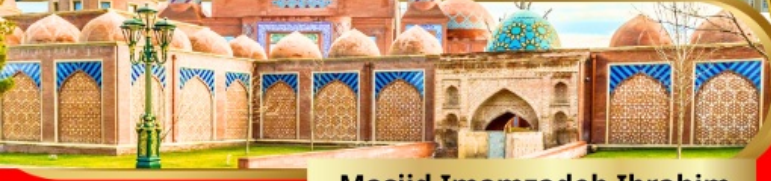
Masjed Imamzadeh Ibrahim