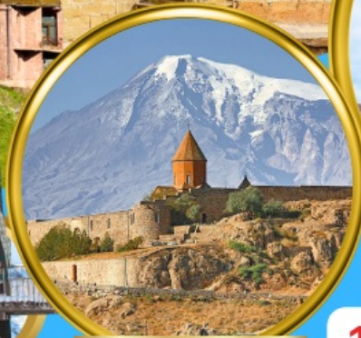
Khor Virap Monastery