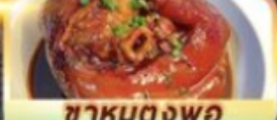
ชาหมตงฟอ