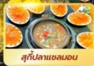
สุกี่ปลาเซลมอน