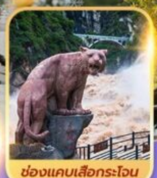
ช่องแคบเลื่อกระโจน