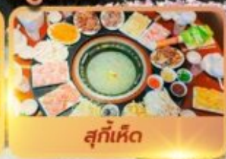
สุกั้เห็ด