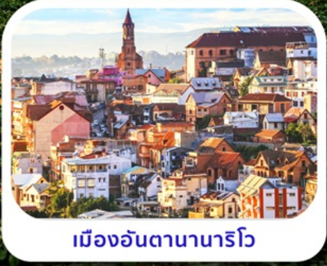
เมืองอันตานานารีโว