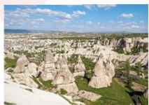
หุบเขาเดเฟเรนท์

** พักที่ Dedeli Cave Hotel 5* หรือเทียบเท่า **