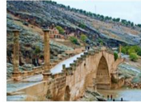
สะพานเซเวอร์รัน