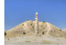
สุสานคาราคูช